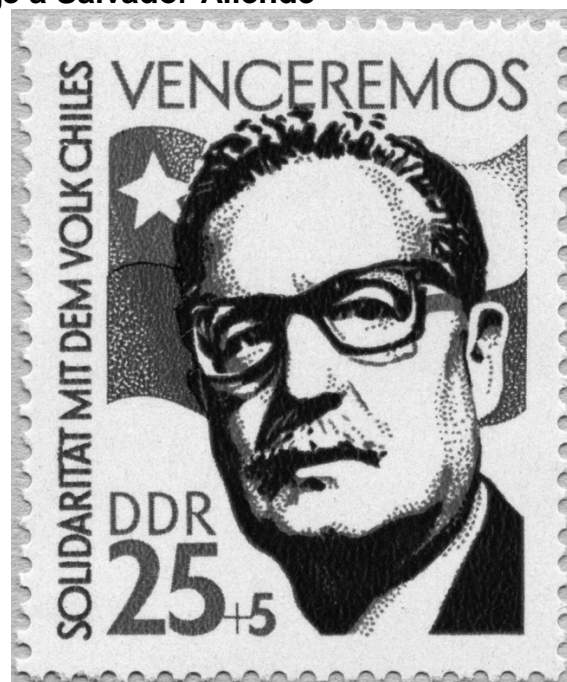
Venceremos, “Solidaridad con el pueblo chileno”